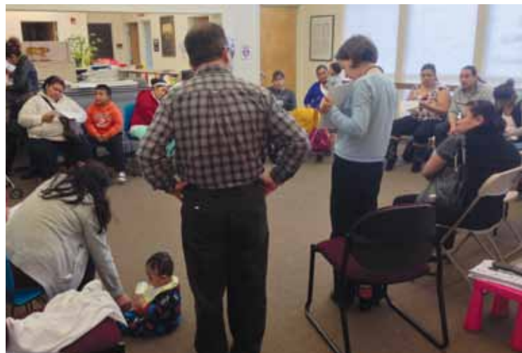
▲ Las familias aprenden como apoyar el desarrollo positivo de sus hijos en el programa de Incredible Years de Bienestar