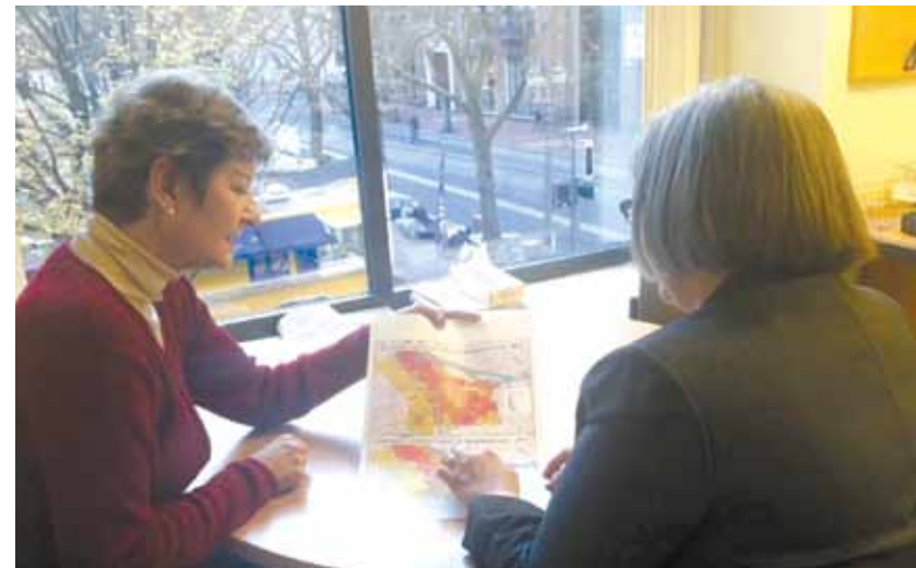
▲ Revisión del personal de los delitos relacionados con la violencia doméstica en el Condado de Multnomah