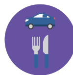
Питание с доставкой на дом