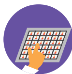
Технические средства/ технологии реабилитации