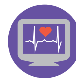
Специализированное медицинское оборудование и принадлежности