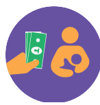
Выплаты родителям по уходу за детьми