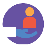
Поддержка в дневное время