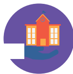
Поддержка, предоставляемая школой