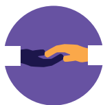
Уход на дому Поддержку и развитие навыков повседневной жизни обеспечивает персональный патронажный работник (PSW) или агентство.