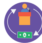
Возмещение расходов: на принадлежности, обучение и материалы непосредственно лицам/семьям. Выплаты должны осуществляться поставщику услуг, включая утвержденных PSW.