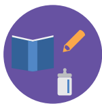
Уход за ребенком (услуги няни)