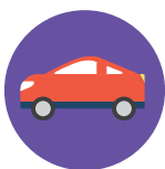
Переоборудование транспортных средств