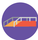
Переоборудование дома и домашние принадлежности